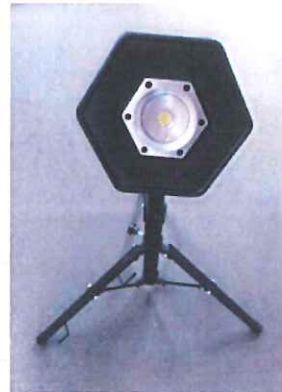
ラークライト1台取付