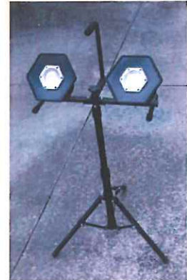
ラークライト2台取付