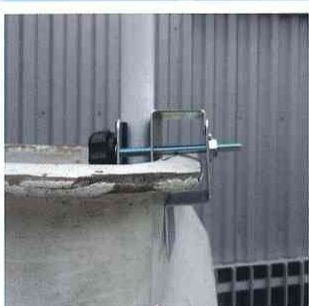
アイチコーポレーション