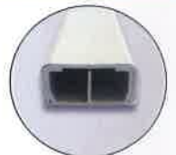
B型セパレートタイプ

強電、弱電を分ける 施工の際に便利な B型セパレートタイプを リリースしました。