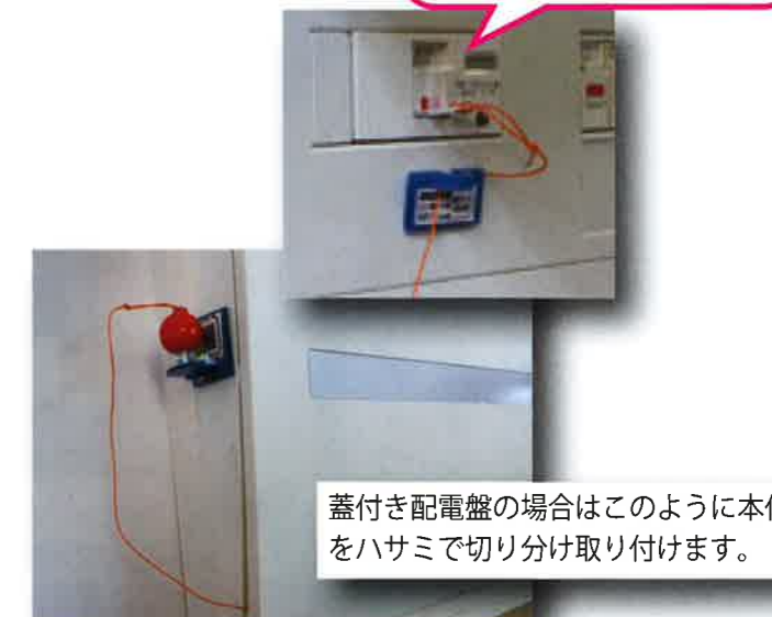
蓋付き配電盤の場合はこのように本体をハサミで切り分け取り付けます。