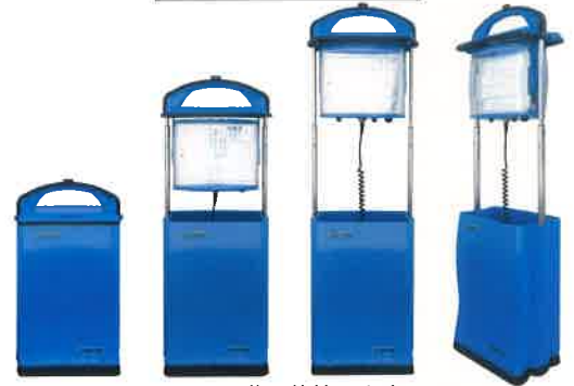
2段階に伸縮します