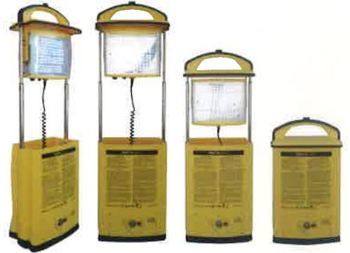
裏側にも照明があります