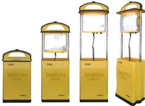
2段階に伸縮します