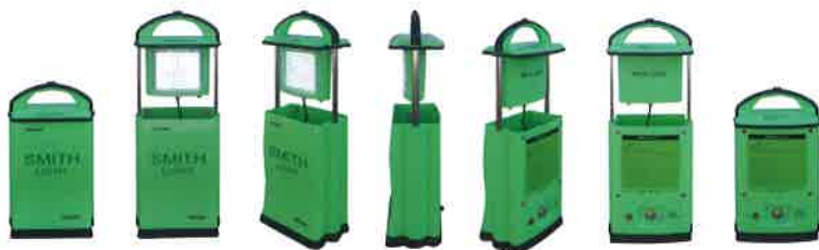
1段階に伸縮します