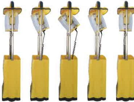
ライト部分を前後に傾けられます